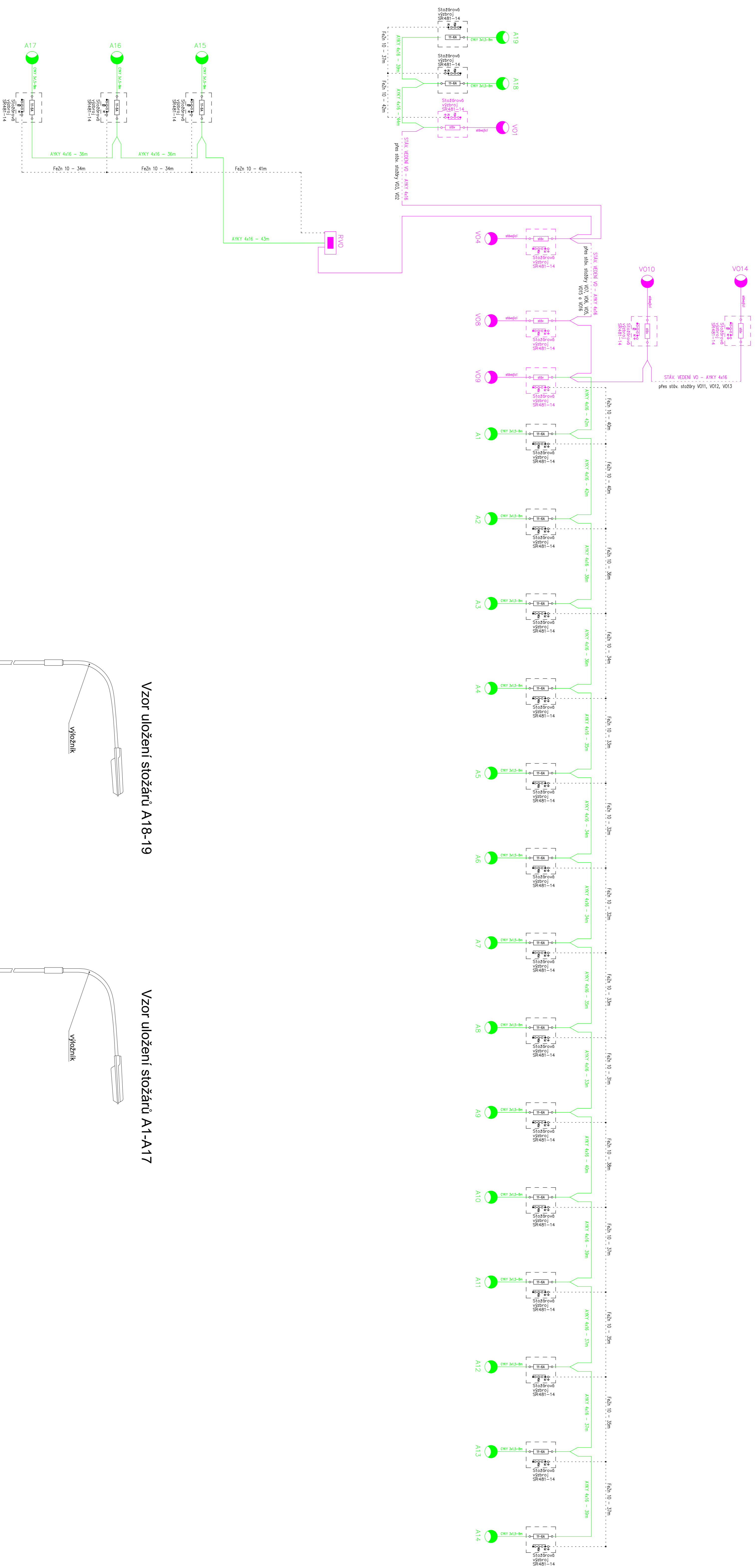
Vzor uložení stožárů A18-19